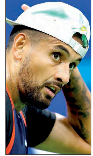
হতাশ কির্গিয়স।