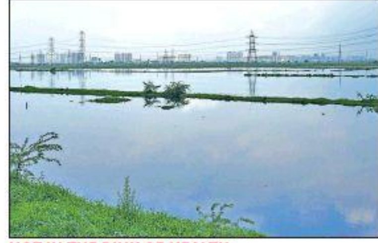
NOT IN THE PINK OF HEALTH

The tribunal was also informed that an expert committee was examining Delhi's EMP to identify actions that could be carried out independently.